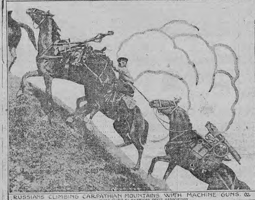
RUSSIANS CLIMBING CARPATHIAN MOUNTAINS WITH MACHINE GUNS.

Una simple ojeada al grabado demuestra el esfuerzo extraordinario que represnetan las operaciones militares actualmente ejecutadas por los rusos en los Montes Cárpatos, en donde han obtenido repetidos éxitos sobre las fuerzas austriacas que defienden desesperadamente esa posición estratégica de primera categoría.